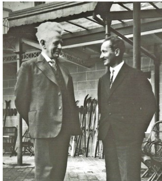
Ernst Cassirer (a sinistra) e Martin Heidegger